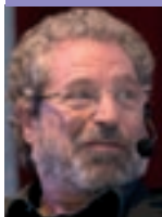
Ramon Font Advocat www.ramonfont.cat

Ara, quan tots hem tornat a les trinxeres de la quotidianitat i hem deixat enrere el món utòpic de les vacances, on la realitat es transmuta, m'agradaria poder perllongar-vos la ficció d'aquells dies feliços i despreocupats i dir-vos, com fan molts, que la pandèmia ens ofereix una segona oportunitat que sabrem aprofitar i que els fons europeus Next Generation i l'Agenda 2030 ens esplanaran la vida i serem capaços de construir un món nou.